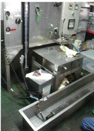
バブルポイント試験