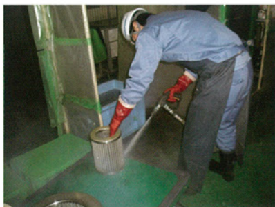
① 高圧ジェット洗浄